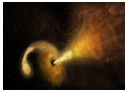
Рис. 4. Перетекание вещества с большой галактики на малую

Астрономам хорошо известно явление перетекания вещества со звезды на звезду или с одной галактики на другую. Оно получило название «перетаскивания кадров». Особенно отчетливо это явление наблюдается в «тесных системах двойных звезд или галактик» рис. 4. На этом рисунке весьма отчетливо проявляется особенность этого процесса, состоящая в неизменности положения центров скоплений звезд, в то время как периферийные слои движутся с ускорением. Это объясняется тем, что в центрах скоплений \nabla\rho = 0 , в то время как для периферийных слоев оно нарушается. В результате одна звезда или галактика как бы «раздевает» другую. При этом «раздевается» не обязательно меньшая из галактик: всё зависит от спонтанно возникшего градиента плотности материи в той или иной области пространства, как это и следует из биполярного закона гравитации (5). Это напоминает «раздевание» одной галактики другой, имеющей большую «крутизну» фронта d\rho/dr , а не размеры. Это отчетливо видно, где рукав большой галактики, ускоряясь по мере приближения к малой закон галактике, постепенно утоньшается и нагревается. Такие нити пронизывают всю видимую часть Вселенной, что послужило причиной называть их «паутиной Вселенной». Её наличие свидетельствует о распространённости в космосе явления перетока вещества с одной звезды или галактики на другую.