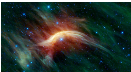
Рис. 1. Ударные волны от слияния галактик.

Согласно энергодинамической теории гравитации, в пространстве с неоднородной плотностью неизбежно возникают обычные акустические (продольные) волны. Наиболее крупные волны такого рода