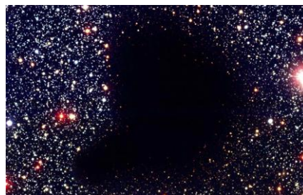
Рис. 2. Войд Волопаса

Как следует из закона гравитации (12), в области пониженной плотности волны ( \rho < \bar{\rho} ) гравитационные силы действуют в направлении «сглаживания» волны, т.е. увеличения её длины \lambda . Это означает, что область пониженной плотности стремится расшириться, вызывая удаление звёздных скоплений друг от друга (разбегание галактик). Это и обуславливает хорошо известный астрономам факт существования так называемых «войдов» – космических пустот огромных размеров (свыше миллиарда световых лет), свободных от небесных тел. Одно из наиболее крупных из них – войд Волопаса – показан на фотографии НАСА. Энергодинамика объясняет отсутствие в войдах небесных тел именно низкой плотностью в них скрытой массы (от \sim 10^{-27} до \sim 10^{-34} г см -3 ), что явно недостаточно для возникновения процесса её конденсации.